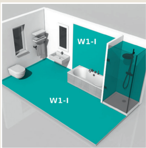
Häusliches Bad mit Badewanne und Duschtasse und Duschtrennung.

W2-I hohe Einwirkungen durch Wasser, z. B.: