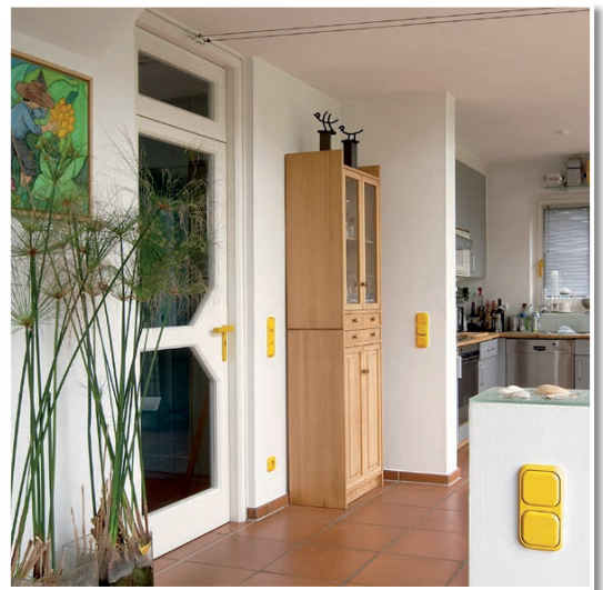
Neue Steckdosen. Mit ELEKTRIKERGIPS montiert.

Wichtig: ELEKTRIKERGIPS vor dem Überstreichen und Überputzen mit BESTE BASIS grundieren.