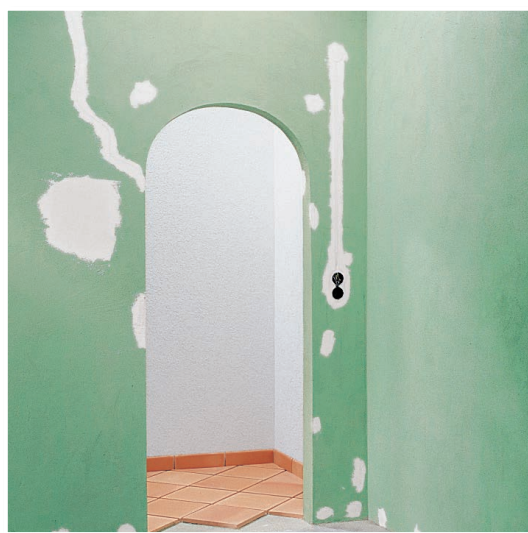
Rebouchage des fissures à l'aide de l'enduit de rebouchage et d'égalisation GLATTE SACHE.

Astuce pratique : pour les travaux urgents, p. ex. pour la pose de prises de courant, utiliser LUGATO ELEKTRIKERGIPS, et pour enduire les surfaces, utiliser LUGATO MALERSPACHTEL.