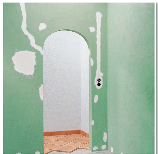
Rissverschluss mit GLATTE SACHE.

Praxistipp: Für eilige Arbeiten, z. B. zum Einsetzen von Steckdosen, LUGATO ELEKTRIKERGIPS und für Flächenspachtelungen LUGATO MALERSPACHTEL verwenden.