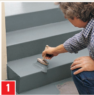
Abriebfeste Versiegelung einer Betontreppe: NEUER ANSTRICH im Farbton platingrau.