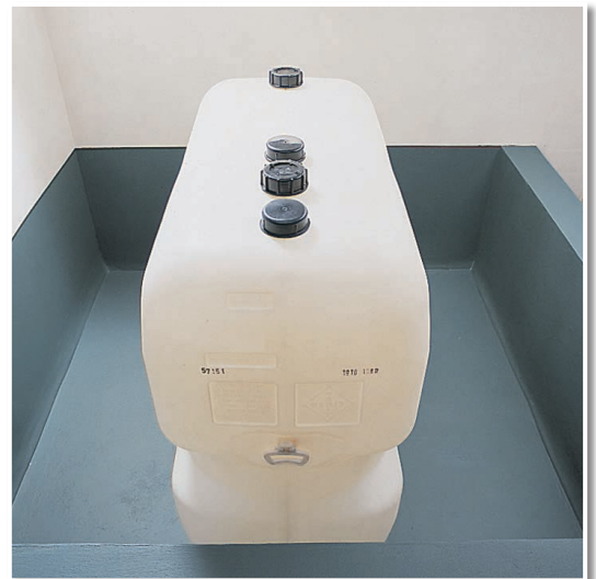
NEUER ANSTRICH – hier als Schutzanstrich für Ölauffangräume.

Auszug aus dem allgemeinen bauaufsichtlichen Prüfzeugnis Nr. P-57.111: „NEUER ANSTRICH eignet sich zur Beschichtung von Beton-, Putz- und Estrichflächen in Auffangwannen und Auffangräumen für Heizöl EL, sowie ungebrauchte Motoren- und Getriebeöle innerhalb allseitig geschlossener Gebäude.“