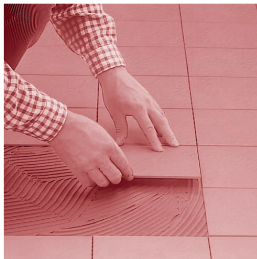
Collage de carrelage sur chape chauffée.

Pour murs et sols. Pour l'intérieur et l'extérieur.