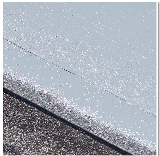
Perfekt mit DACHABDICHTUNG 1K.