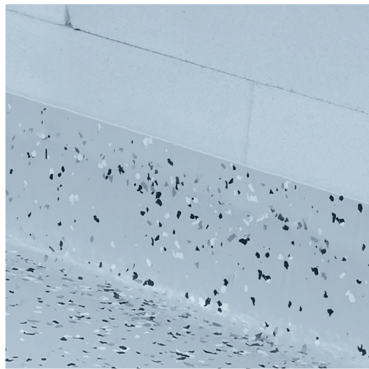
FLÜSSIG-BESCHICHTUNG 1K mit DEKOR-FARBCHIPS veredelt.