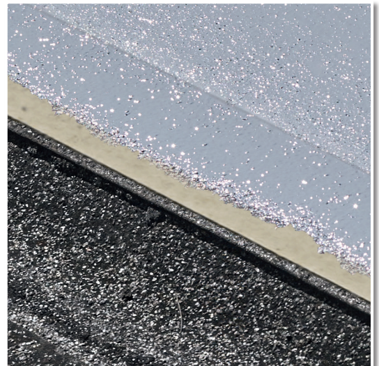
Perfekt mit MULTIFUNKTIONS-ABDICHTUNG 1K PRO.