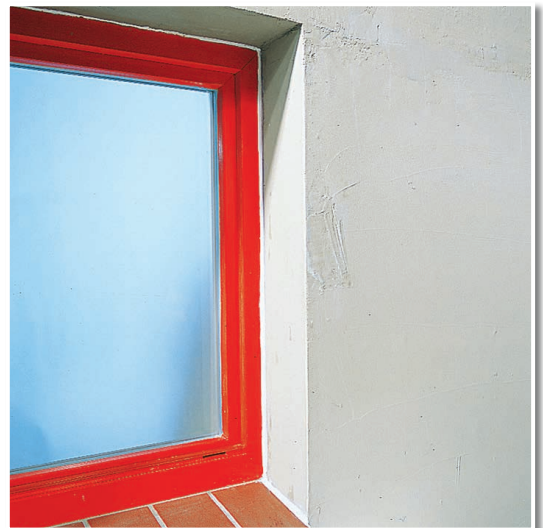
Verschluss der Anschlussfugen zwischen Fenster und Mauerwerk.