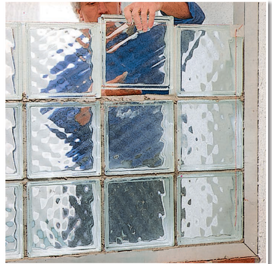
Ideal auch zum Setzen von Glasbausteinen.

Innen und außen. An Boden, Wand und Decke.