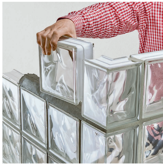
Ideal auch zum Setzen von Glasbausteinen.

Innen und außen. An Boden, Wand und Decke.