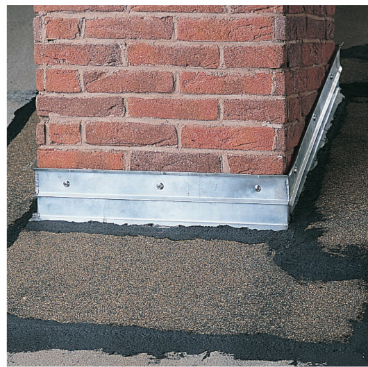
Kapelleiste am Schornstein mit SCHWARZER BLOCKER SPACHELMASSE und Bitumenbahn abgedichtet.