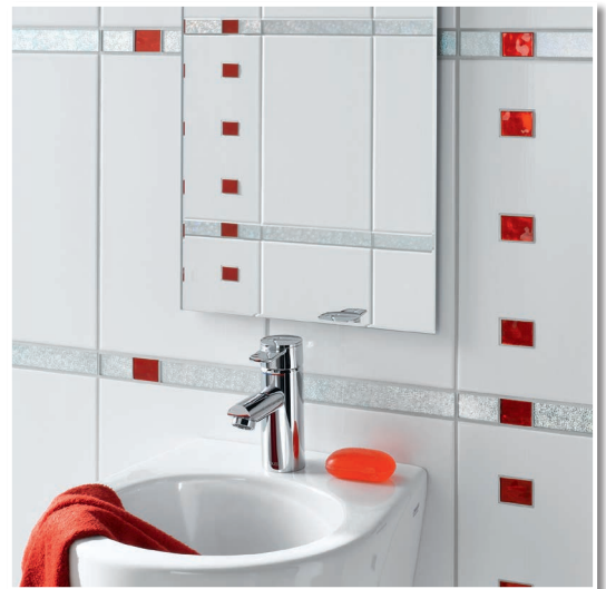
Spiegel in einem modernen Badezimmer geklebt.