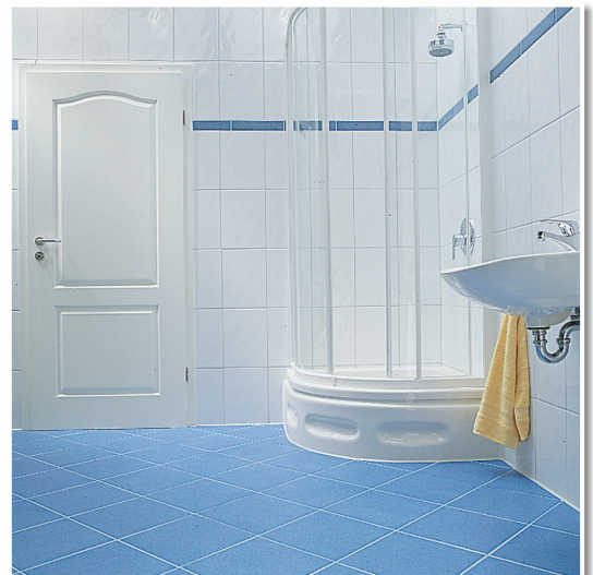
Die fertige Dusche. Eck- und Anschlussfugen elastisch geschlossen.