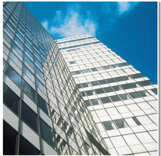
Widersteht Wind und Wetter. Hier an einer Glas-Alu-Fassade.