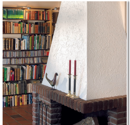
Kaminschürze rustikal gestalten. Repräsentativ, dekorativ, strapazierfähig.