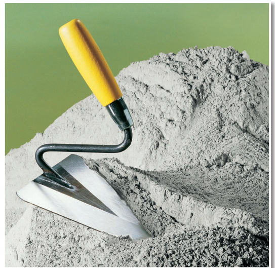
Weißer Portlandzement für das individuelle Bauen.

Zum Selbstanmischen von verschiedenen Mörtelarten, z. B. Reparaturmörtel, Fugenmörtel, Putzmörtel.